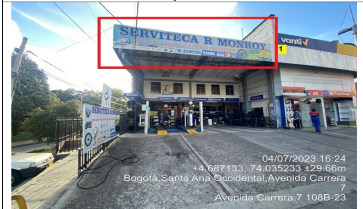
Fotografía No. 2

En la cual se evidencia la fachada del establecimiento comercial SERVITECA R.MONROY, en la que se observa: un (1) elemento publicitario tipo aviso en fachada identificado con el número 1, el cual está volado de la fachada.